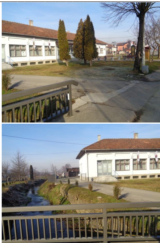
Слика4. Фотографије постојећег стања

РЕПУБЛИКА СРПСКА ОПШТИНА СТАНАРИ НАЧЕЛНИК ОПШТИНЕ