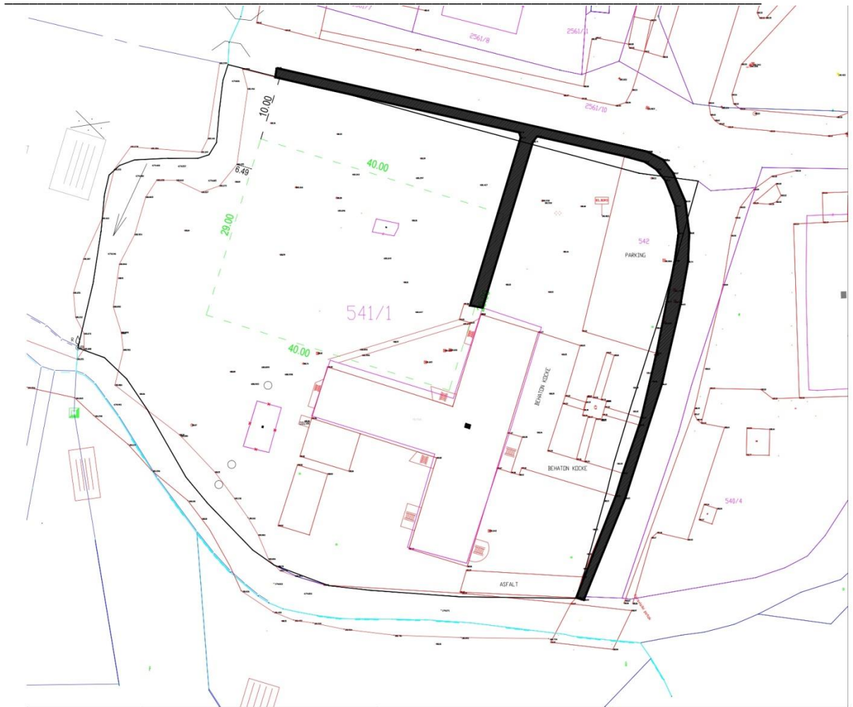
Слика 3. Постојећи пјешачки саобраћај

РЕПУБЛИКА СРПСКА ОПШТИНА СТАНАРИ НАЧЕЛНИК ОПШТИНЕ