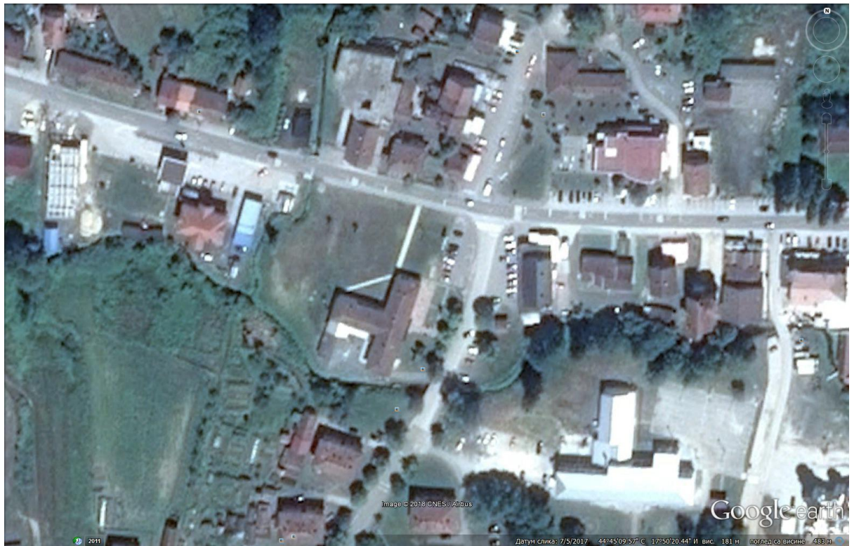
Слика 1. Ортофото снимак

Предметна локација има приступ на регионални пут 474а Разбој- Руданка и локалну саобраћајницу која води у унутрашњост насеља.